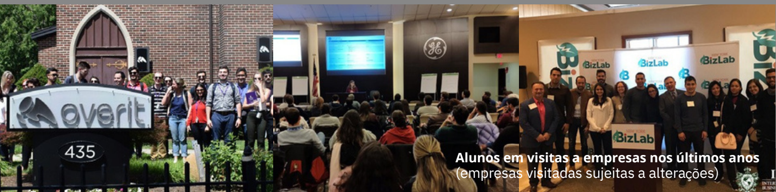
Alunos em visitas a empresas nos últimos anos (empresas visitadas sujeitas a alterações)

Impulsionar sua carreira e aumentar a lucratividade de sua empresa com técnicas que atraem mais clientes e mais investidores, ao mesmo tempo em que contribuem para um mundo melhor.