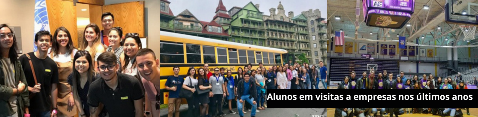
Alunos em visitas a empresas nos últimos anos